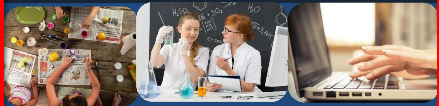
MODELLO A TEMPO PROLUNGATO