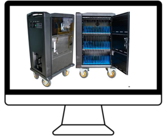
Tre laboratori mobili di informatica 60 chromebook