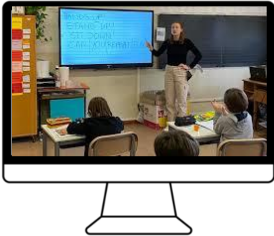
lavagne digitali connesse a internet